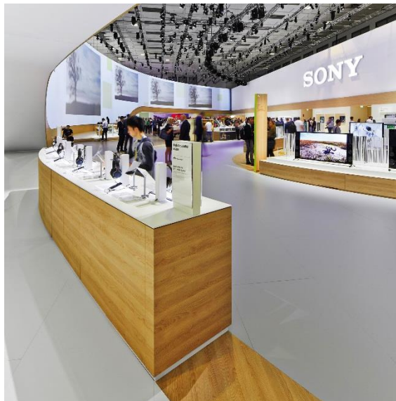
Mobilier / Design interior