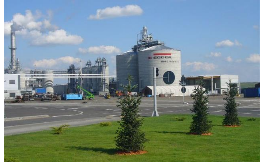
din 2008 și în Rădăuți