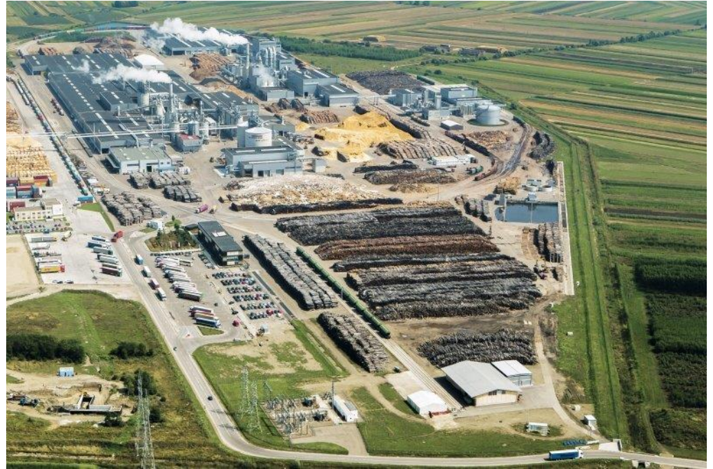
Fabrica EGGER din Rădăuți