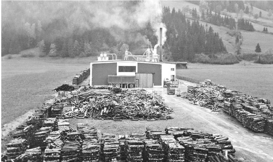
Prima noastră fabrică din St. Johann in Tirol, 1961