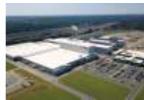
Lexington, NC (US)