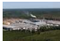
Rion des Landes (FR)