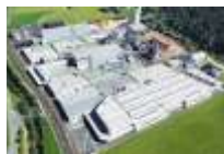
St. Johann (AT)

Acest lucru e dovedit de fabricile și afilierile noastre cu firme la nivel mondial