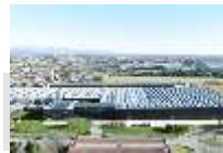
Cleaf (IT) participație 27,5 %