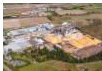
Markt Bibart (DE)