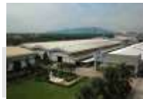
Panel Plus (TH) participație 25,1 %